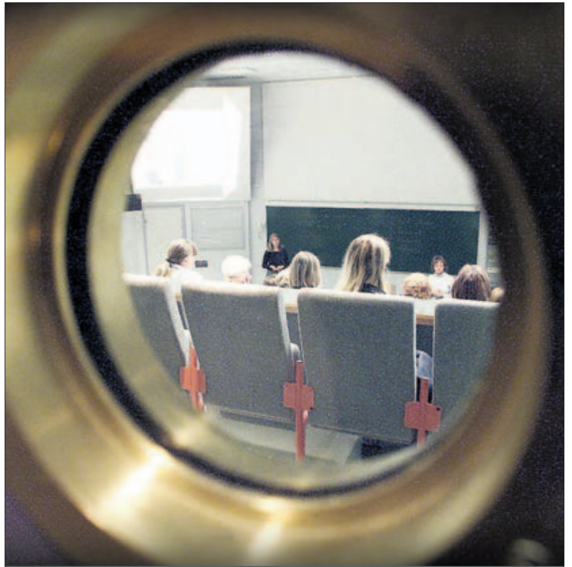
NÆRT KNYTTET: UiT og UNN har i alle år vært nært knyttet til hverandre. Gjennom fusjonen av UiT og Høgskolen i Tromsø er dette blitt forsterket.

Helsepersonell blir i den kommunen hvor de har bodd under utdannelsen.