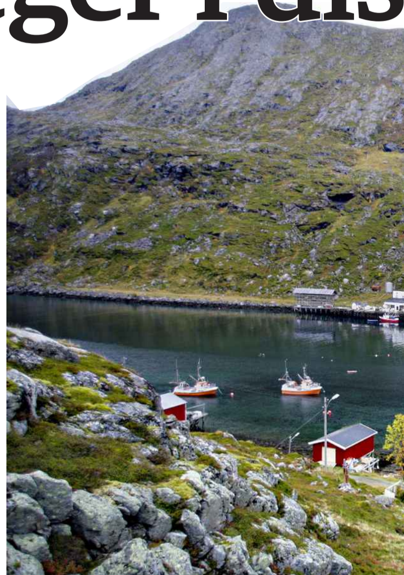
OVERRASKENDE POPULÆRT: Etter turnus i Finnmark valgte 37,5% av O

å gjøre en trygg og god jobb. I mange land i verden vil dette være ensbetydende med å jobbe på store sykehus. I Norge har vi en relativt sterk helsetjeneste også i distriktene. Andre land med grisgrendte strøk setter sykepleiere til å gjøre legejobber, fagmiljø forvitret og kolleger her land advarer derfor mot å fjerne vår sentrale legefördeling via turnus.