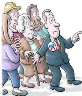
"There he goes, scaring everybody again."

Clay Bennett har jobbet som politisk avistegner siden 1981, og tegner i dag for Chattanooga Times Free Press. Trebarnsfaren har vært nominert til Pulitzerprisen seks ganger, og vant den prestisjefylte prisen i 2002.