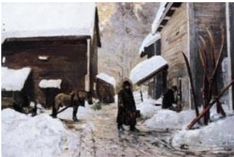
Doktoren vender hjem. 1888 Gerhard Munthe